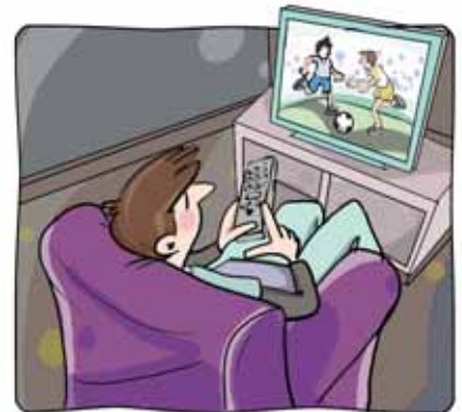
6 _____ la televisión.

2 Escribe el pretérito indefinido de los siguientes verbos.