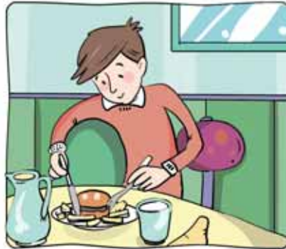
2 _____ una hamburguesa.