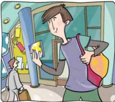
4 _____ en la FNAC y _____ un CD.