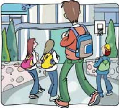
1 _____ al instituto.

jugar • comprar • ver • ir • hacer • estar • comer