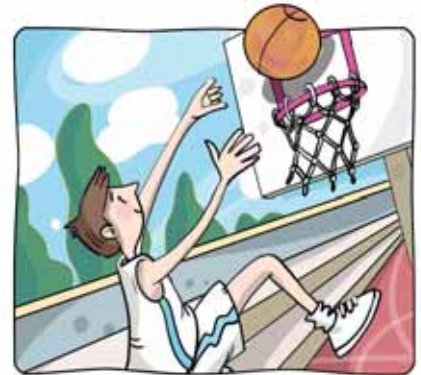
3 _____ al baloncesto.