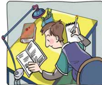
5 _____ los deberes.